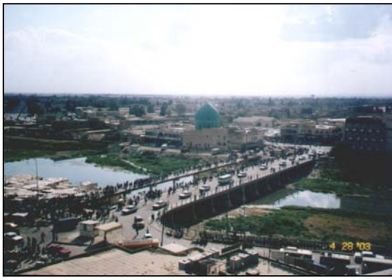
نجاة كوثر اوغلو