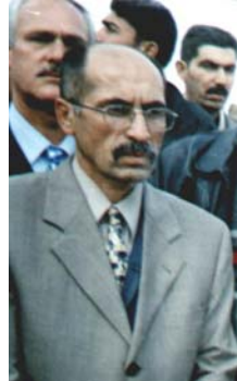
السيد نجم الدين قصاب اوغلو