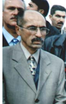
السيد نجم الدين قصاب اوغلو