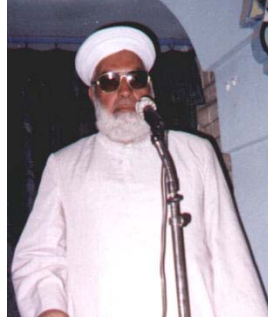
الشيخ عبد العزيز المشهداني