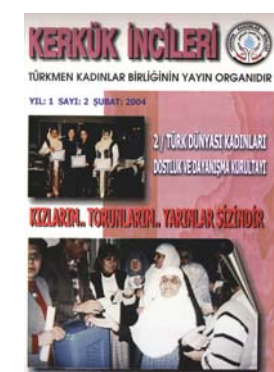
عن اتحاد نساء التركمان في العراق صدر العدد الثاني