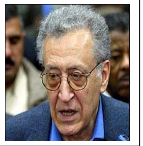
وات: بتاريخ 2004/2/10 استقبل السيد الأخضر الإبراهيمي ممثل الأمين العام للأمم المتحدة في العراق، الدكتور فاروق عبدالله