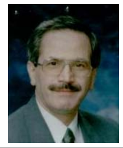
وات: بتاريخ 2004/2/10 استقبل السيد الأخضر الإبراهيمي ممثل الأمين العام للأمم المتحدة في العراق، الدكتور فاروق عبدالله

عبد الرحمن رئيس الجبهة التركمانية العراقية والسيدة صونكول جابوك عضو مجلس الحكم الانتقالي، وتم خلال اللقاء بحث موضوع الانتخابات المزمع إجراؤها في غضون الأشهر المقبلة ووضع الشعب التركماني الذي يمثل القومية الثالثة في العراق والجبهة التركمانية العراقية والتي تمثل أغلبية الشعب التركماني.