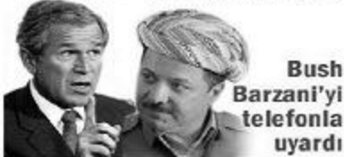
Bush Barzani'yi telefonla uyardı